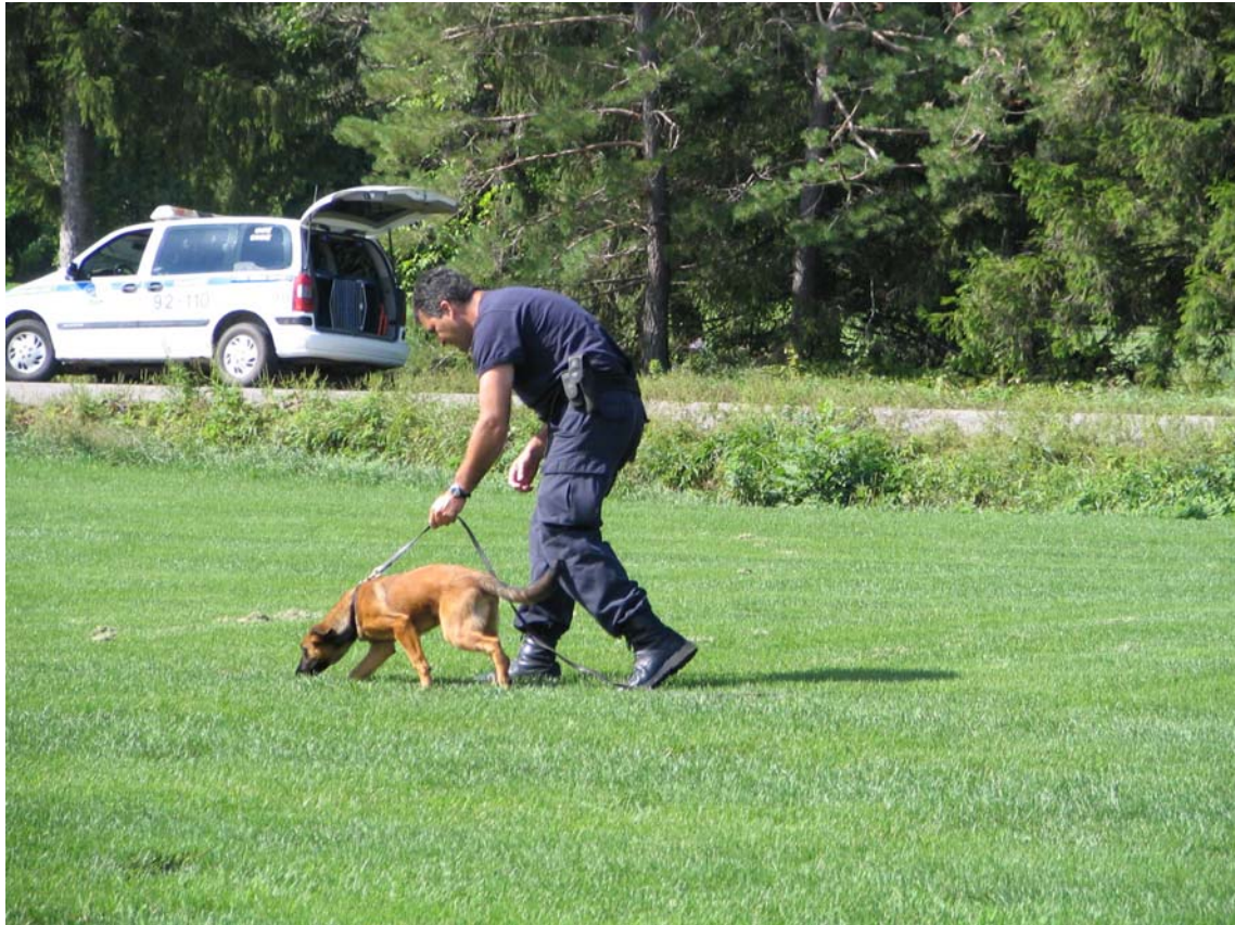
Chiot de quatre mois en apprentissage de dépistage.

Depuis plusieurs années, notre section s'est dotée d'un programme de développement de chiots visant à préparer la relève autant pour ses chiens que pour ses futurs maîtres-chiens. Des chiots sont ainsi placés en famille d'accueil chez des policiers (ères) de notre service qui s'occupent principalement de leur socialisation et de leur développement sous la supervision du module formation de l'unité. Ce programme nous permet de bénéficier de chiens adultes possédant une base solide avant même qu'ils soient jumelés à un maître-chien vers l'âge de 18 à 24 mois.